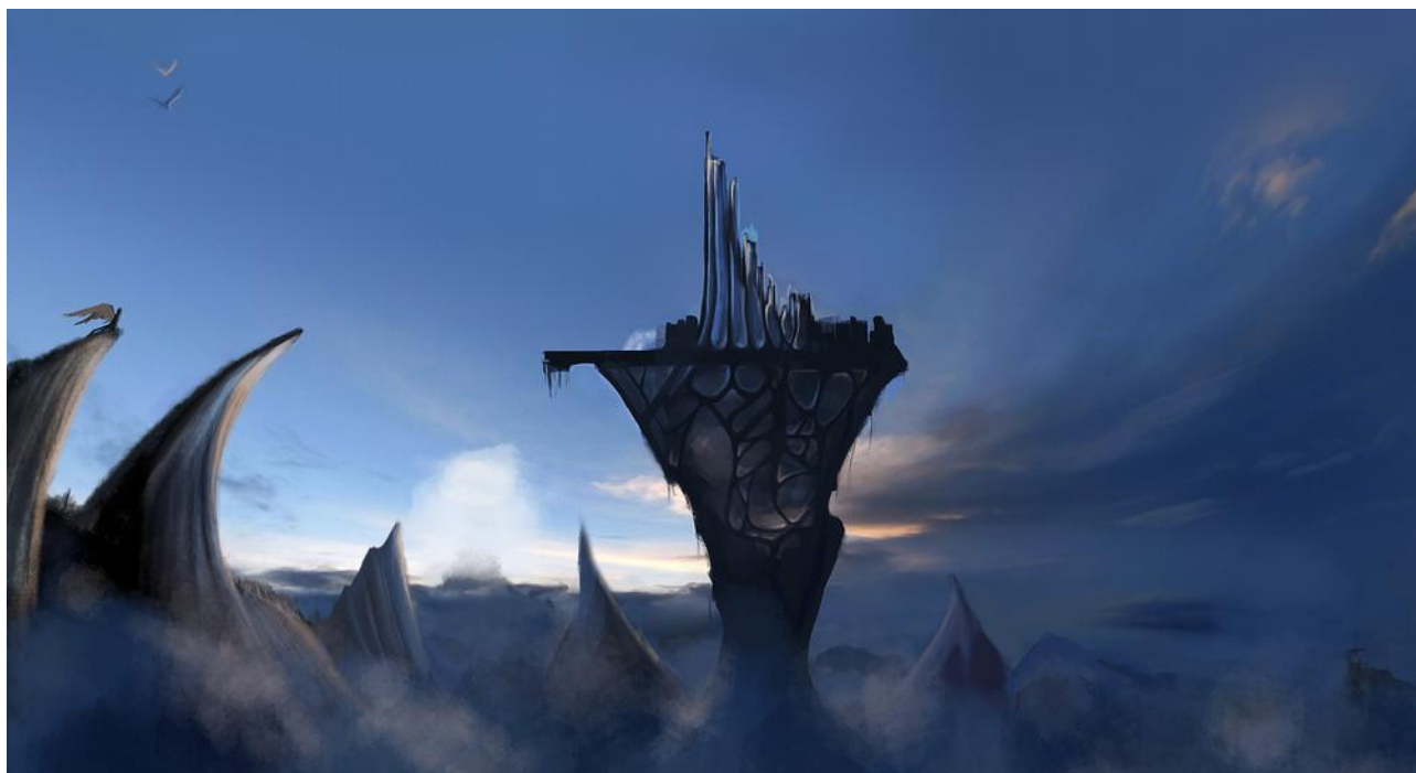
Illustration de la cité, speed-painting numérique

Le monde est divisé en trois, un peu à la façon de la seconde topique Freudienne, avec son conscient, préconscient et inconscient ; là le monde est divisée entre la Bibliothèque (le Léviathan, le contrat social), La Cité (Autonomos, la ville de construite par Raison) et le Jardin des Sentiments, à la base, sous les nuages.