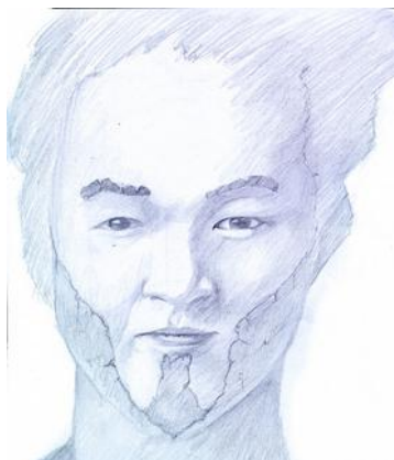
Le Choeur, design crayon

actes déplacés finissent par s'accumuler et prendre des proportions cataclysmiques. C'est également ma vision du modernisme, cette envie de se débarrasser du passé en oubliant que le passé est également une source intarissable d'informations.