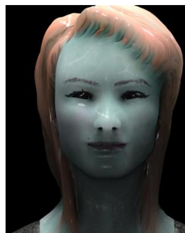
Modélisation 3D de Modernité

Le rôle de Modernité, comme méchant d'Allégorie, vient clairement de C.S. Lewis. Modernité est un personnage complexe à définir, le propos n'étant pas d'en faire un méchant manichéen, mais bien un caractère à part entière. Étant personnellement allergique aux vilains en tant que simples antagonistes aux personnages héroïques, je me suis senti obligé de faire un antagoniste bien pensant, pas fermé mais dont les