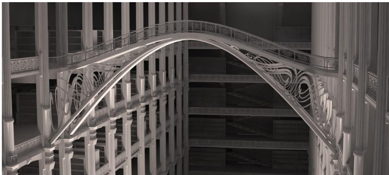
Design 3D non texturé de la salle centrale de la Bibliothèque