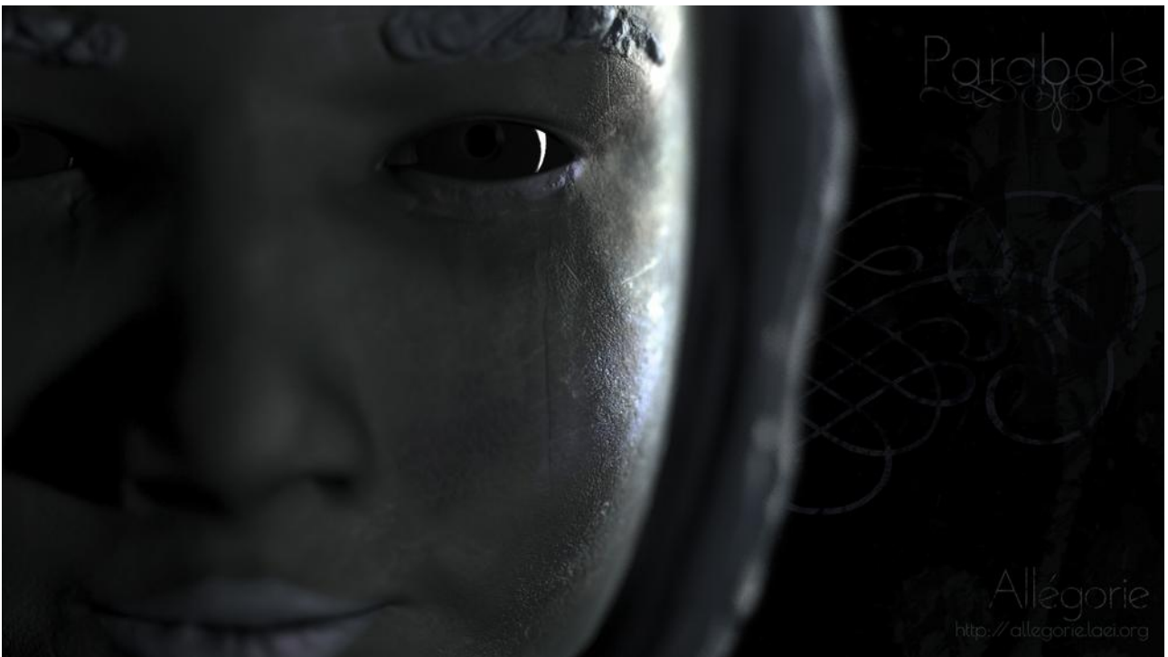
Modélisation 3D de Parabole

La Bibliothèque sombre doucement dans l'obscurité. Dialectique vient de disparaître et Parabole part à sa recherche pour découvrir à ses dépens que le monde n'est pas confiné à la Bibliothèque et que la lumière existe, par de là ses murs... Mais pour l'atteindre, il lui faudra mourir, questionner son propos, accepter de ne plus être celle qu'elle croyait être et confronter l'attitude macabre de Modernité.