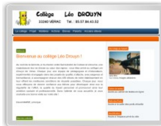
Collège Léo Drouyn